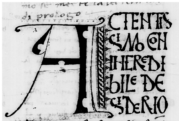
Paris BnF It. 455, c. 2r: Nicolò di Ingegne, Librecto di pestilencia (Galatina/Taranto, 1448)

Ancora più netta la somiglianza tra i caratteri dell'epigrafe e la grafia del ms. Paris BnF It. 595; quest'ultimo, non a caso, è un testimone confezionato in ambiente neretino, nella seconda metà del sec. XV (entro il 1487), dal copista Guido di Bosco di Nardò e destinato, insieme ad altri esemplari 10 , alla corte di Angilberto del Balzo, conte di Ugento e duca di Nardò. Il confronto con questo ms. non lascia spazio a dubbi circa la possibile datazione della didascalia (II metà del sec. XV). Si noti la straordinaria somiglianza delle grafie: