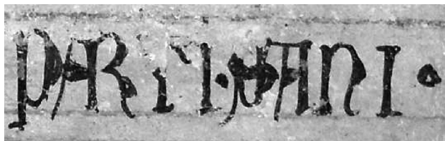
Nardò, Cattedrale, Epigrafe , r. 1 (ante 1456)